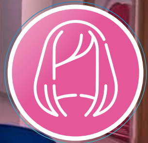
FUNDACIÓN COLOMBIANA PARA LA PREVENCIÓN Y TRATAMIENTO DEL CÁNCER